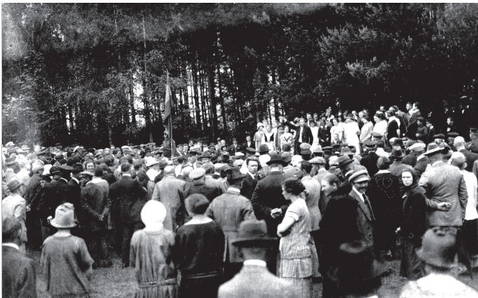
Vydūnas kalba Joninių šventėje ant Rambynų kalno. 1925 m.