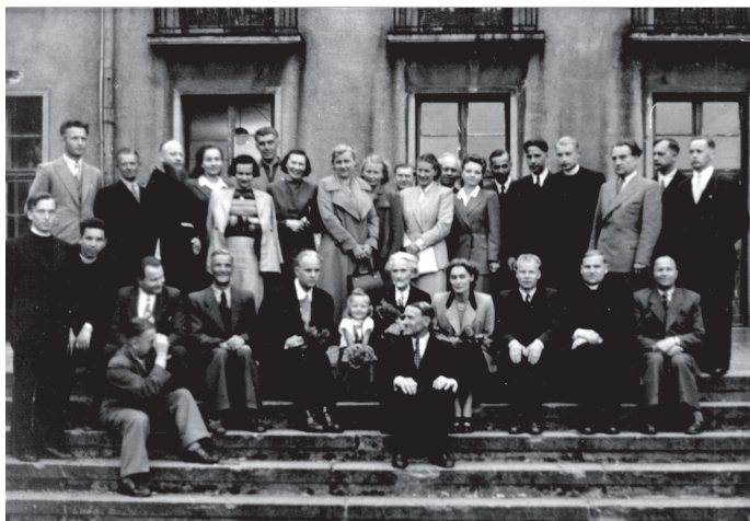
Prie lietuvių gimnazijos Diepholce. 1951 m.