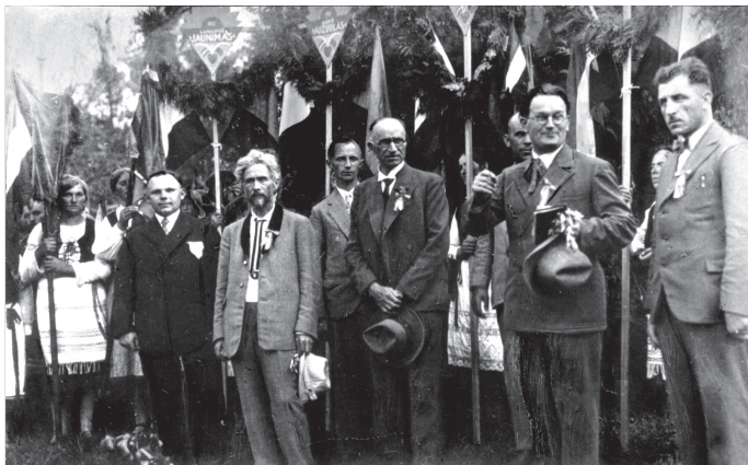
Joninių šventė Juodkrantėje. 1930 m.