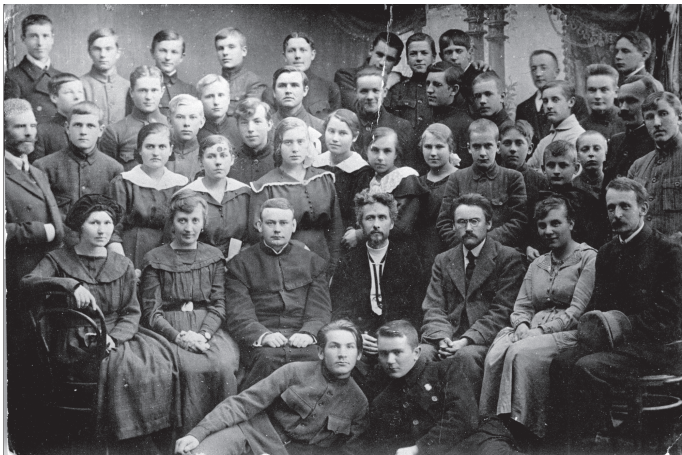
Vydūnas su Telšių gimnazijos mokytojais ir mokiniais. 1920 m.