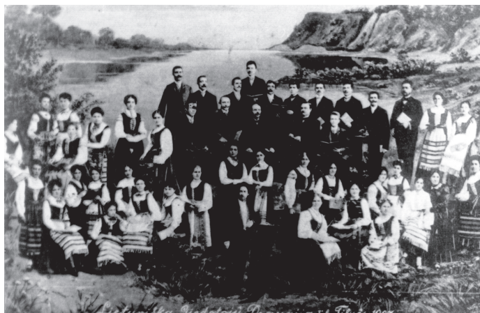
Vydūnas su Tilžės giedotojų draugija. 1907 m.